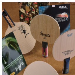
「秋の新製品! イチオシ試打」