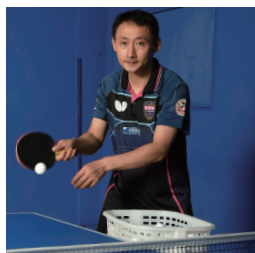
「短時間で強くなる! 最強の多球練習」